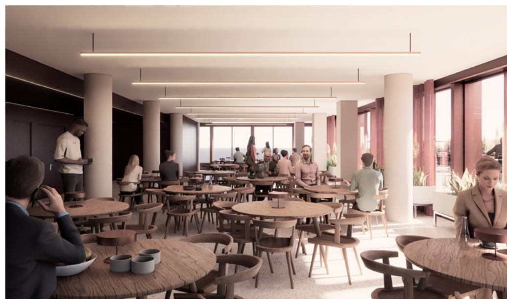
Personalrestaurant - illustrasjon av mulig innredning.